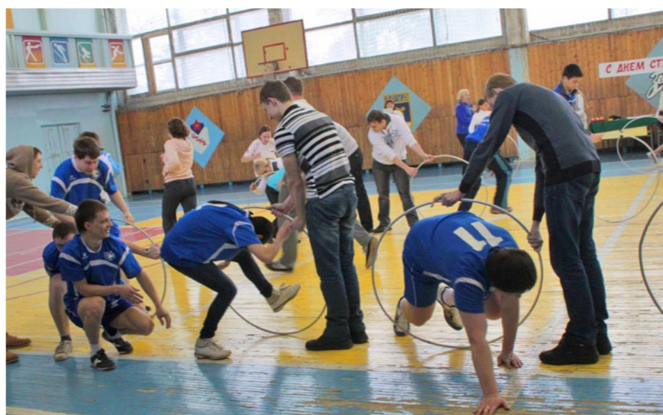
Организаторы усложнили челночный бег акробатическими этюдами: нам приходилось в буквальном смысле просачиваться через обручи. Получилось неуклюже, но очень весело